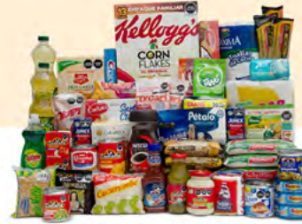
RESILIENCIA $1,171.00 MXN | 52 ARTÍCULOS