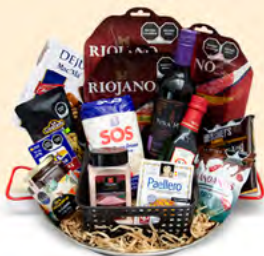
MEDITERRANEO ARCÓN 01 | $1,830.00 MXN