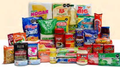
SERVICIO $654.00 MXN | 37 ARTÍCULOS