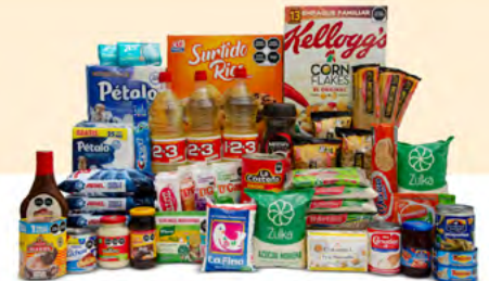
ALIANZA $1,586.00 MXN | 48 ARTÍCULOS