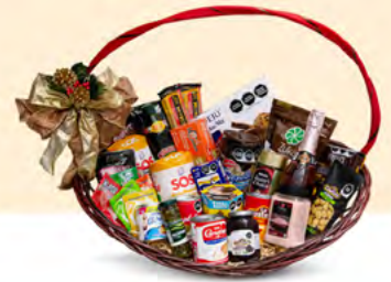
NACIONAL ARCÓN 05 | $2,209.00 MXN