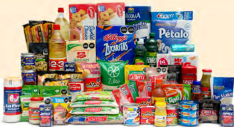
TRASCENDENCIA $1,379.00 MXN | 64 ARTÍCULOS