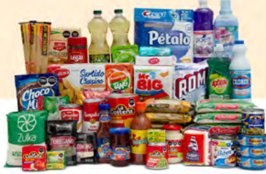
DIVERSIDAD $1,119.00 MXN | 52 ARTÍCULOS