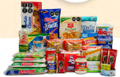
UNIÓN $451.00 MXN | 29 ARTÍCULOS