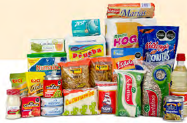
VALOR $352.00 MXN | 23 ARTÍCULOS