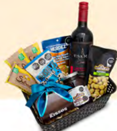
ENSENADA ARCÓN 02 | $519.00 MXN