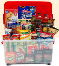
IDEAL $970.00 MXN | 40 ARTÍCULOS