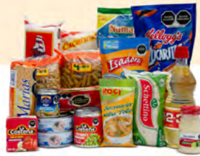
VISIÓN $252.00 MXN | 18 ARTÍCULOS