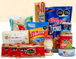
MISIÓN $153.00 MXN | 12 ARTÍCULOS