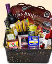
SAN JUAN ARCÓN 04 | $1,134 MXN