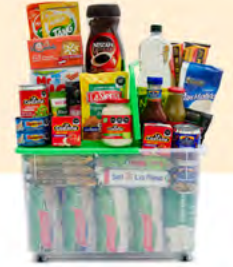
SINERGIA $871.00 MXN | 33 ARTÍCULOS