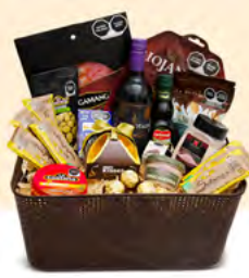
CONTINENTAL ARCÓN 03 | $1,423.00 MXN