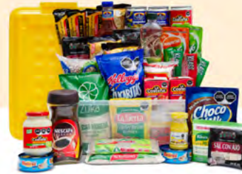
ORGULLO $766.00 MXN | 38 ARTÍCULOS