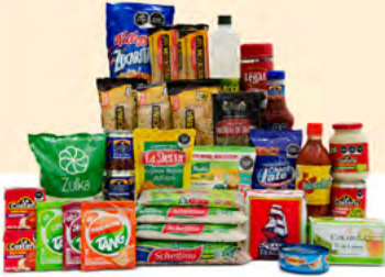
MOTIVACIÓN $560.00 MXN | 32 ARTÍCULOS