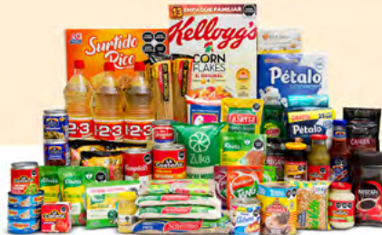
CUSPIDE $1,482.00 MXN | 53 ARTÍCULOS