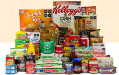
INNOVACIÓN $1,276.00 MXN | 47 ARTÍCULOS